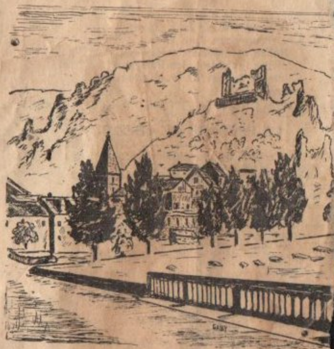
L'entrée de Guillaumes