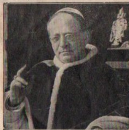
Sa Sainteté PIE XI