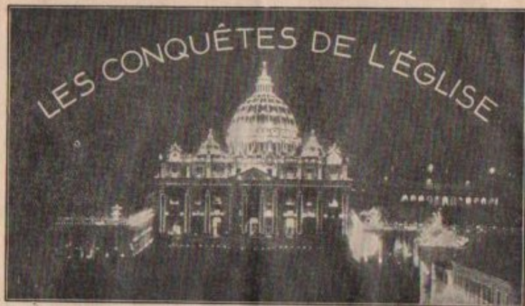
Illuminations de la Basilique St-Pierre du Vatican