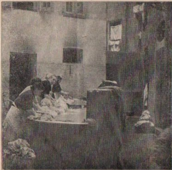
Combien de coups de battoir ?...

Jésus disait : « Je fais toujours ce qui plaît à mon Père. » Si nous faisons toujours ce qui plaît à Dieu ; si, l'âme tournée vers Dieu, comme Marie vers Jésus, nous faisons tout pour Lui : Menuisier, combien de coups de marteau, de hache et de scie !... Ménagère, combien de coups de balai, de points de couture !... Femme de journée, combien de coups de battoir, de coups de brosse et de torchon !... Dactylo, compositeur, combien de lettres manipulées ou tapotées sur le clavier !... Cultivateur, jardinier, combien de pas derrière la charrue, combien de coups de bêche dans le sillon !... Si, tout cela, vous le faisiez pour Dieu, avec soin, avec amour... Mais il n'y aurait rien à changer à votre vie pour que vous soyez des Saints. Le secret de la sainteté, le voilà : la main à l'œuvre et le cœur à Dieu ! Multipliez donc les actes d'amour de Dieu dans vos actions ordinaires en accomplissant le mieux possible votre devoir d'état, vous suivrez ainsi le Christ et vous aurez une vie chrétienne, ce qui est le commencement de la perfection.