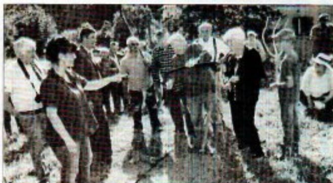
Après la démonstration par les anciens, chacun a pu s'essayer au tissage.