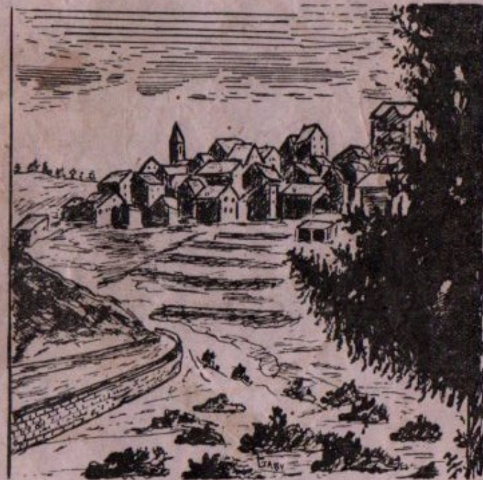
« Nos villages : Beuil »