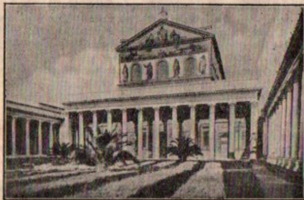
Une des quatre grandes Basiliques romaines SAINT-PAUL-HORS-LES-MURS

2°) pour ceux qui peuvent gagner le Pèlerinage en dehors de Rome : les œuvres prescrites par les évêques.